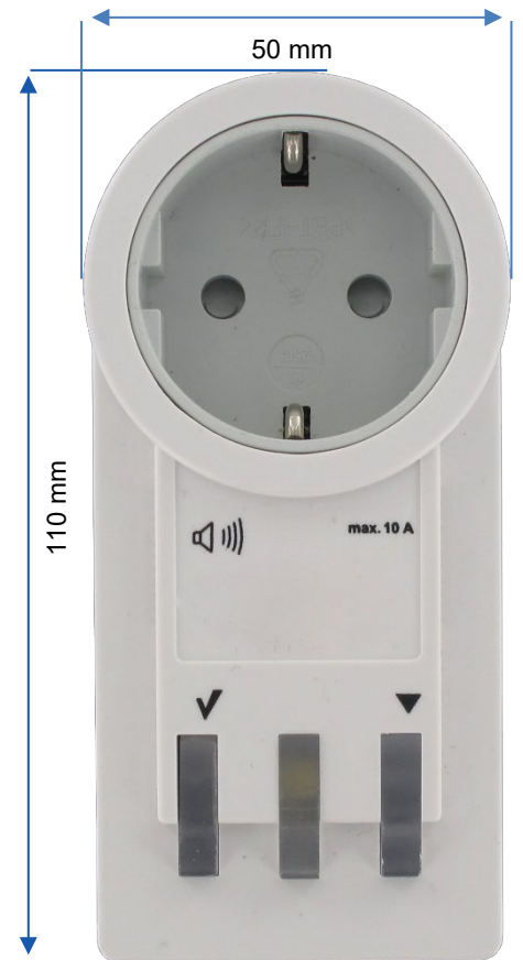
Abb. 1: VarioRec 6 Alarmempfänger Frontansicht